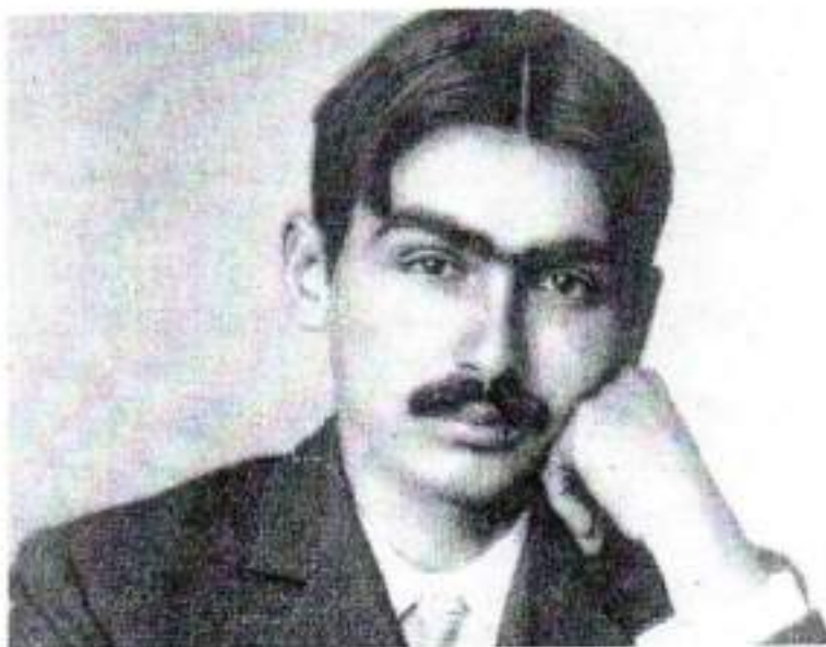
Figura 1. Escritor Monteiro Lobato

Um fato de merecido destaque na história da cidade é que Monteiro Lobato viveu em Areias entre 1907 e 1911, quando no exercício de suas atribuições como Promotor de Justiça. O Arquivo Histórico da cidade conta com vários documentos originais assinados pelo lendário escritor, que condenou à morte Areias e todas as demais cidades do denominado Vale Histórico (Queluz, Silveiras, São José do Barreiro, Arapeté e Bananal) em sua obra "Cidades Mortas", defendendo que estas cidades jamais iriam prosperar por estarem à margem das ferrovias e, conseqüentemente, do desenvolvimento.