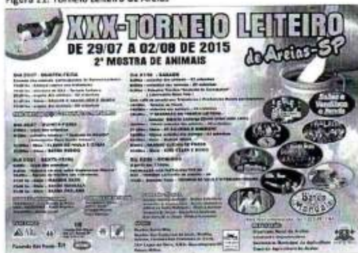
Figura 21. Torneio Leiteiro de Areias

Local: Recinto de Exposições – Rua Prefeito Benedito de Oliveira Ramos