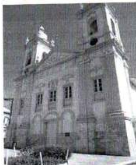
Figura 11. Igreja Matriz

Sua construção foi iniciada em 1792, mas o término só aconteceu em 1874. Houve uma reforma no ano de 1890. No seu interior, estão a imagem de São Miguel e do Cristo Morto, construído em madeira. O sino maior foi objeto de doação do Major Manoel da Silva Leme, em 1863, que pesa 1.100 kg e conta com 1,5 de altura, tendo sido importado da Bélgica. Muito embora esta edificação não seja Tombada, qualquer intenção de intervenção deve passar pela competente autorização do Condephaat, órgão tombador dos imóveis do centro histórico.