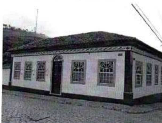
Figura 24. CEMEI Profª Branca de Oliveira Abreu Reis