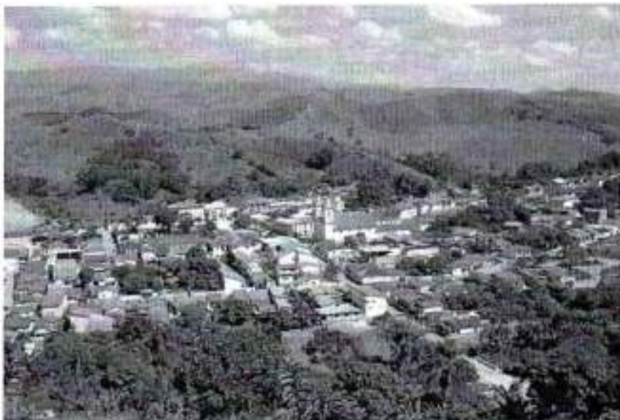
Figura 23. Vista aérea do município de Areias

Reunião de Planejamento e pesquisa inicial de Gabinete