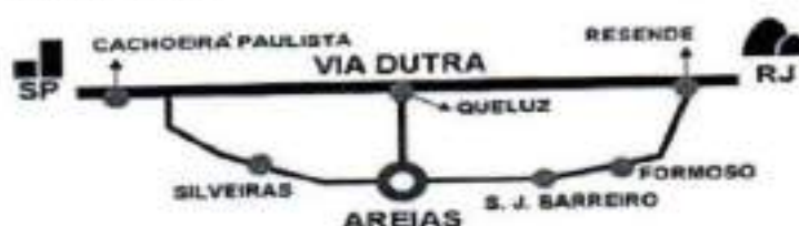
Figura 2. Localização

O município de Areias está localizado entre as coordenadas 22° 34' 47" de latitude sul e 44° 41' 47" de longitude oeste de Greenwich, ao longo da antiga estrada que interligava Rio de Janeiro e a cidade de São Paulo cortando todo o "mar de morros" conhecido atualmente como Rodovia dos Tropeiros – BR 383.