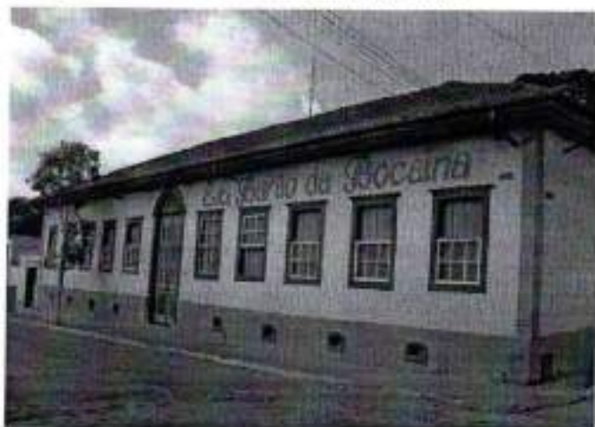
Figura 25. CEMEI Profª Branca de Oliveira Abreu Reis

O prédio que hoje abriga a Escola Estadual "Barão da Bocaina" sediou por muito tempo a escola "Prof. Julio Cesar da Costa Sampaio Filho", e por ocasião da municipalização do ensino o prédio ficou a disposição da escola estadual de ensino médio.