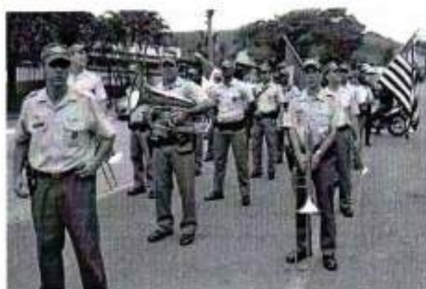
Figura 17. Desfile Cívico da Revolução de 1932

O Desfile Cívico da Revolução de 1932 acontece na prévia do dia 9 de Julho, quando da comemoração da Revolução de 1932. Segundo dados históricos foi no Morro Frio, território de Areias que iniciou o conflito armado que culminou no início da Revolução. Participam do desfile várias representatividades das polícias da região: exército, militar, civil, rodoviária federal e estadual, bombeiros, alunos das escolas municipais e estadual, e grupo de cavalaria de municipes e convidados de cidades vizinhas.