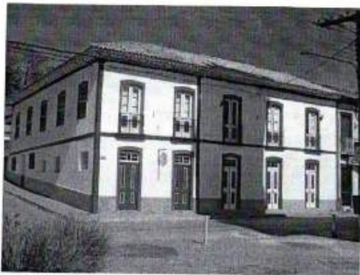
Figura 27. Casarões da Praça 9 de Julho

Estes casarões situam-se ao lado da praça central, Praça 9 de julho. Em virtude do passado cafeeiro rico de meados do século 19, Areias é uma cidade repleta de construções antigas oriunda ainda do período do Brasil imperial. Boa parte deste patrimônio histórico encontra-se preservado e ocupado.