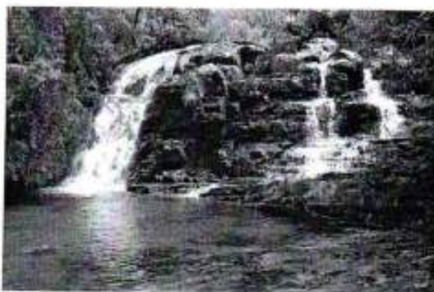
Figura 31. Cachoeira no Parque Nacional da Bocaina

O acesso ao local se dá pela primitiva Rodovia dos Tropeiros de quem vai sentido Areias-São José do Barreiro, entrando à direita depois do letreiro que leva o nome da cidade, tendo como primeira referência a Fazendinha Santa Carlota.