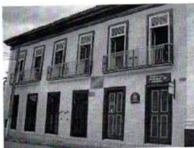
Figura 9. Sobrado na Praça 9 de Julho (Prefeitura Municipal)

Sobrado na Rua Quinze de Novembro, nº 15.