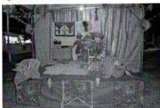
Figura 16. Festa do Miho