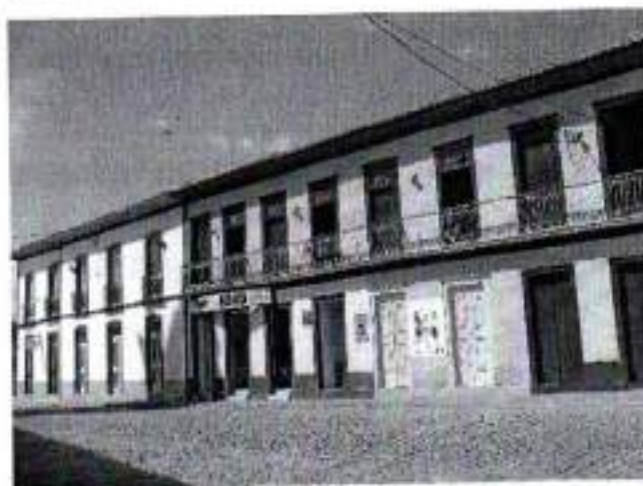
Figura 10. Sobrado da Rua XV de Novembro, nº 15