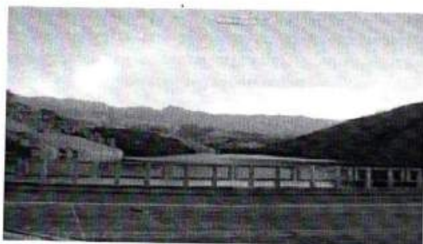
Figura 32. Represa do Funil

O vilarejo chegou a ter três mil habitantes, sendo a metade de escravos, e até o início do século XX ainda era um disputado reduto político, com grande influência nas eleições municipais. Em 1963, foi realizada a última festa do Senhor Bom Jesus, padroeiro local. Em seguida, tudo foi inundado pelas águas da represa do Funil.