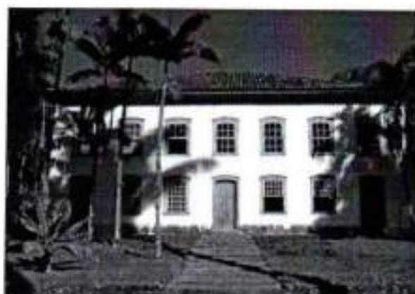
Figura 28. Fazenda Vargem Grande