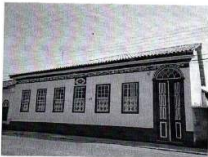
Figura 26. Construção de 1968

do Brasil colonial, fica às margens da Rodovia dos Tropeiros, Rua XV de Novembro, e não muito distante da Igreja Matriz Senhora Sant'Anna.