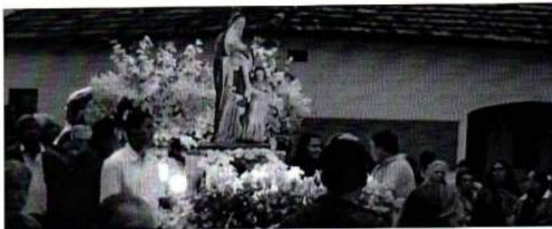
Figura 20. Festa da Padroeira Santana