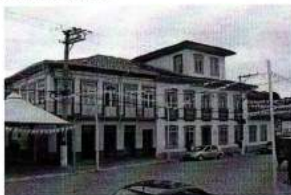
Figura 7. Solar do Capitão-Mór

A construção é em taipa de pilão e pau-a-pique, com pisos e forros em tabuado de madeira, tendo recebido algumas paredes de tijolos quando da sua transformação em hotel, pela prefeitura, sua atual proprietária.