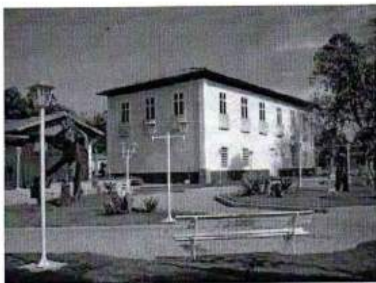
Figura 22. Casa de Câmara e Cadeia (Secretaria Municipal de Cultura, Turismo, Esporte e Eventos)