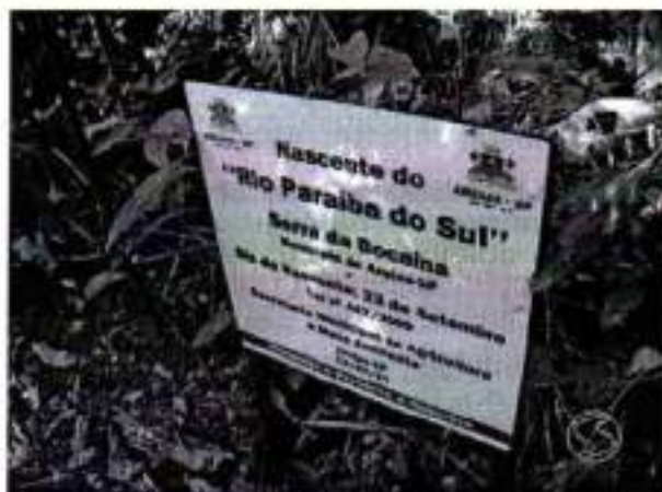
Figura 30. Fazenda Vargem Grande