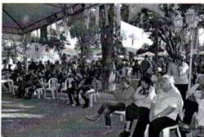
Figura 15. Mostra Cultural