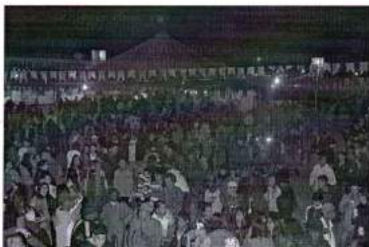
Figura 12. Festa do Micareias