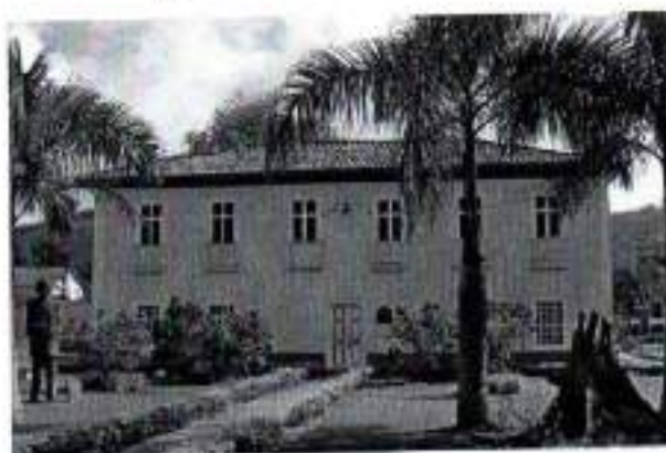
Figura 8. Casa de Câmara e Cadeia

Sobrado na Praça Nove de Julho, nº 202 (antiga Rua Mercês, 6)